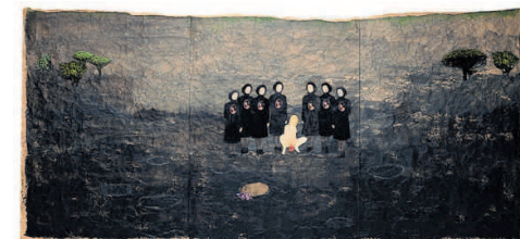
'Tijdstip der geboorte in Tuam II'