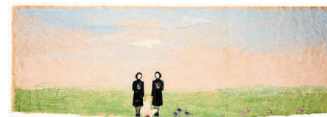
'Tijdstip der geboorte in Tuam I'