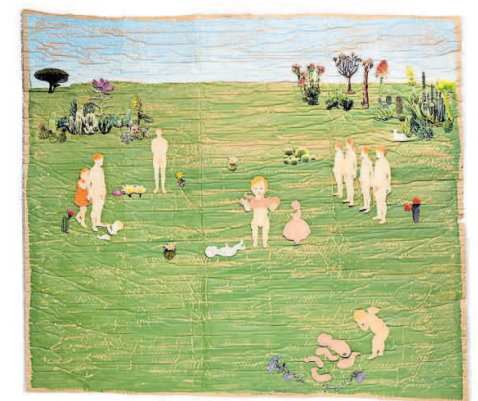
'Thou hast wept to know, that things depart which never may return.'